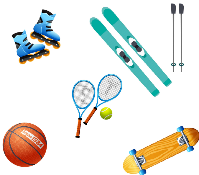
MATERIEL DE SPORT